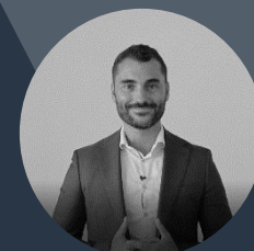
NICOLAS GONÇALVES CEO GROUPE EPSA

Il s'agit toujours d'un enjeu de conviction et d'engagement, et de réussir, d'ici 2026, à aligner les instruments et les leviers d'action de la RSE avec la performance économique de l'entreprise, pour une croissance durable.